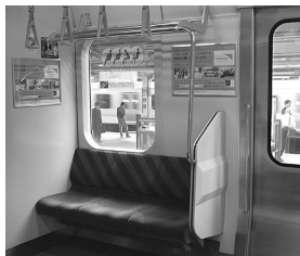
우선석 Priority seats